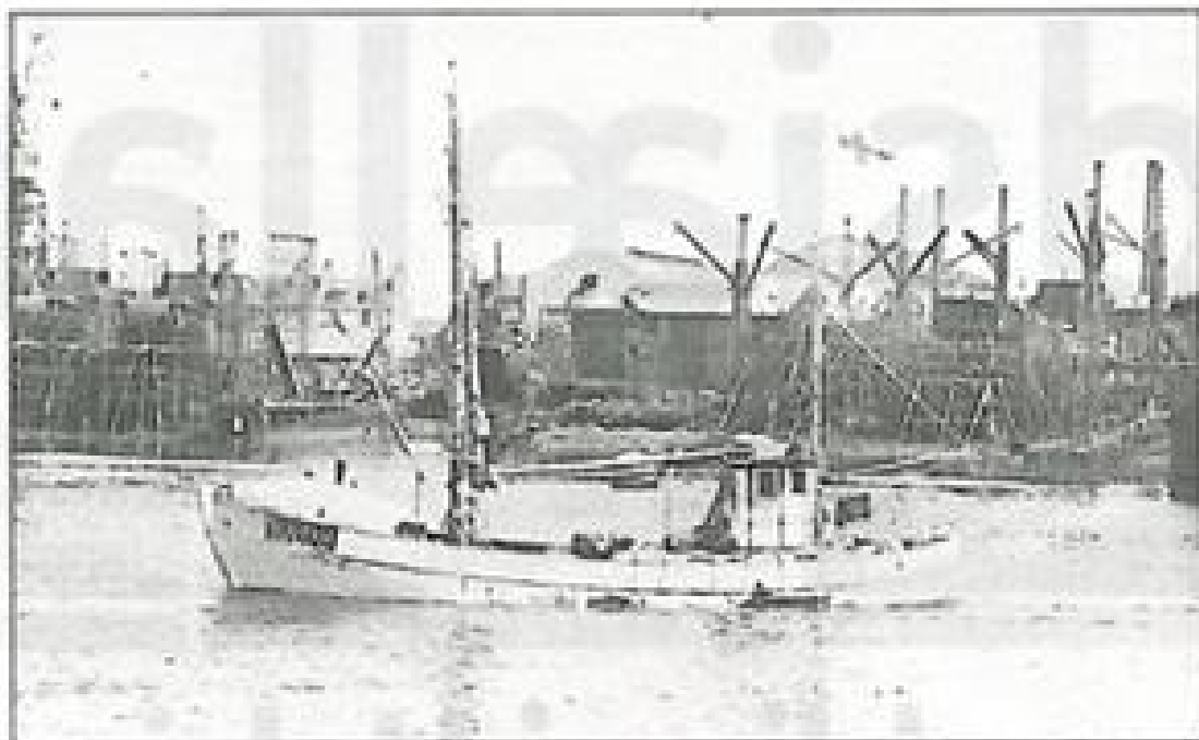
"Alvur" fotograferet mens den stadig fungerer som fiskefartøj - med fuld last.

Han har nemlig i mange år sejlet som skibsfører i DFDS-senset på færgen "Crown of Scandinavia", men tidligere på tre Helsingør-byggede skibe, passagerbåden "England"